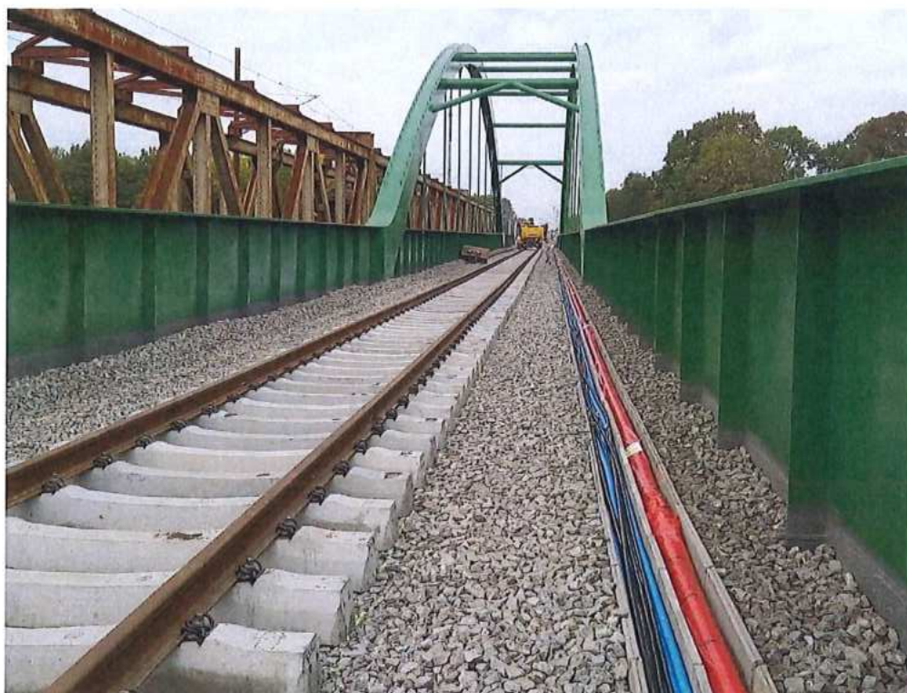
Pokládka chráničiek do kábelových žľabov v km 74,290-74,490