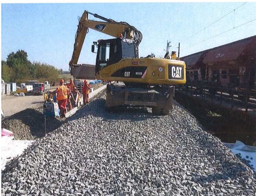
Pokládka kábelových žľabov v km 74,290-74,490