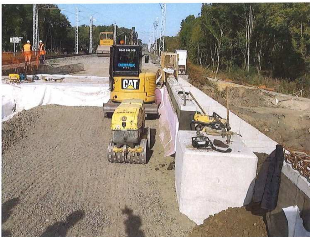
Zásypové práce hutnené po vrstvách – SO 12-33-05