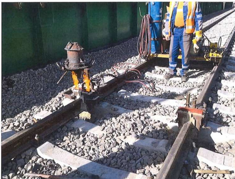
Zváranie koľajníc do bezstykovej koľaje