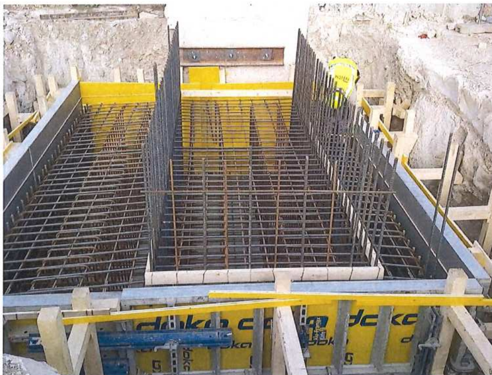
Armovanie a debnenie základu - SO 12-33-01