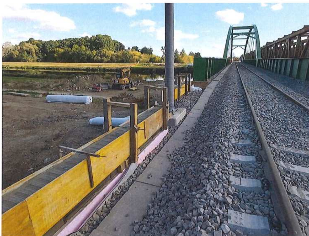
Zabetónovaná rímsa - SO 12-33-05