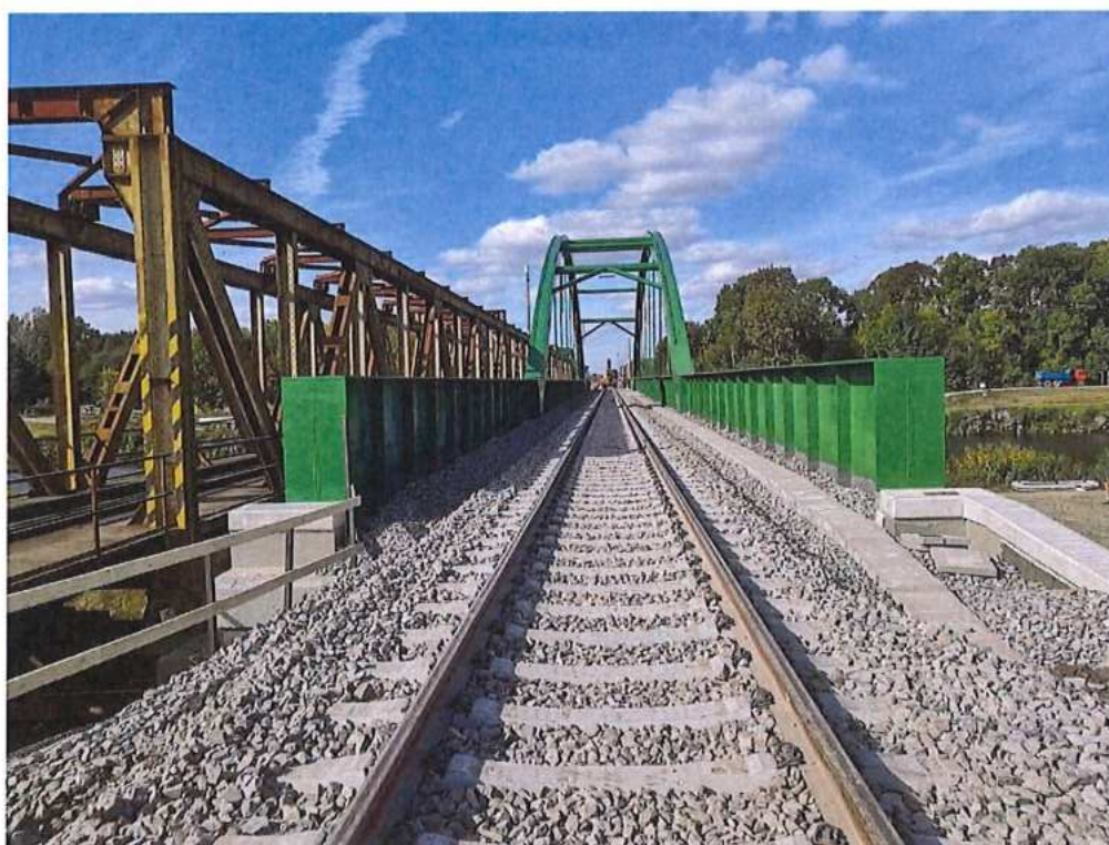
Žel. zvršok a kábelové žľaby na moste SO 12-33-04