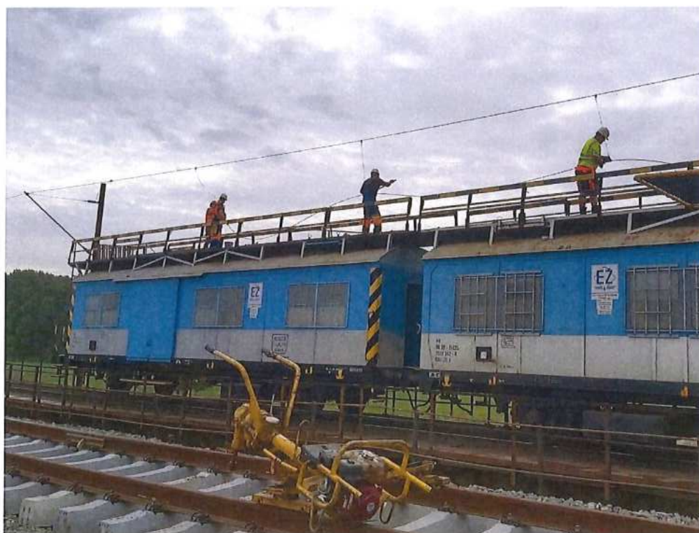
Demontáž trakčného vedenia