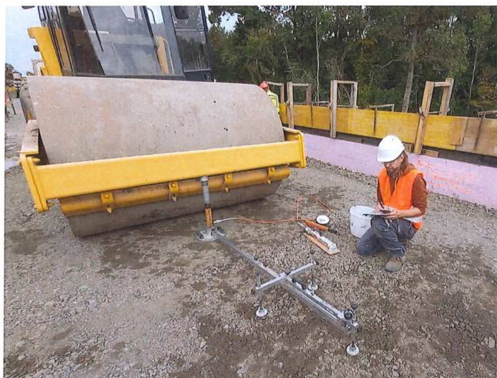
Stat. zaťažovacia skúška prechod. oblasti – SO 12-33-05