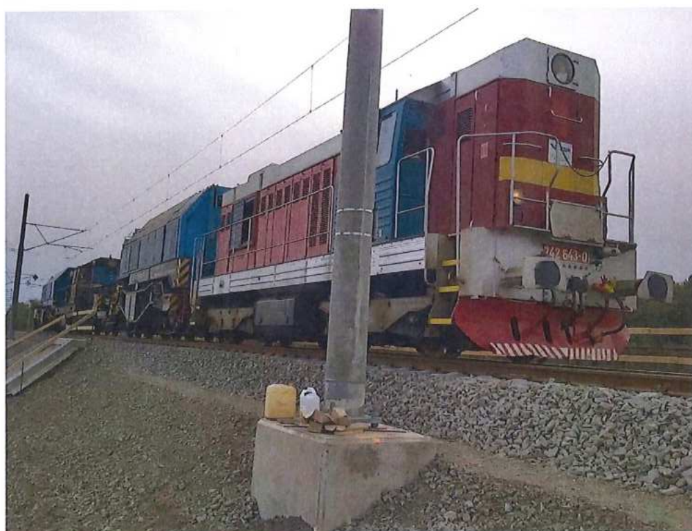
Súprava na realizáciu zaťažovacej skúšky na moste SO 12-33-04