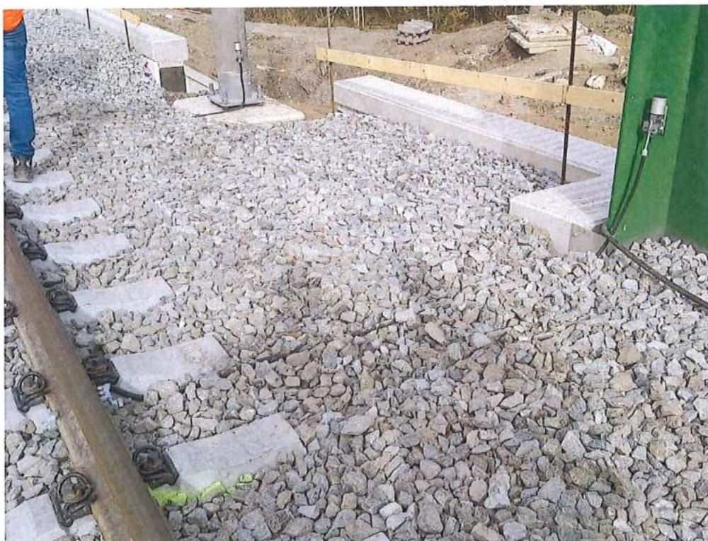
Ukoloňajnenie SO 12-33-04 a stĺpa TV