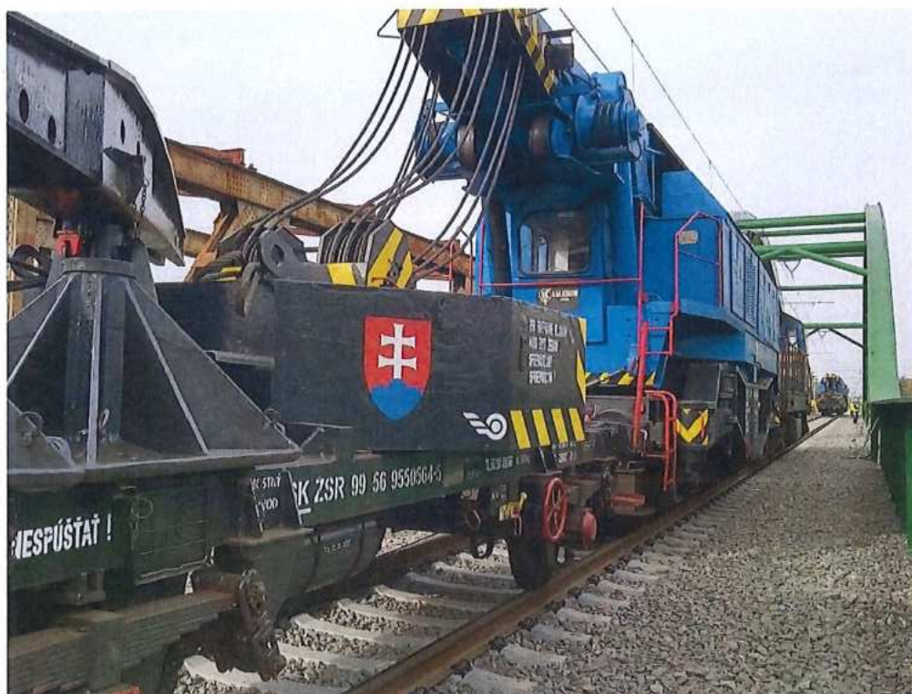
Zaťažovacia skúška mosta SO 12-33-04