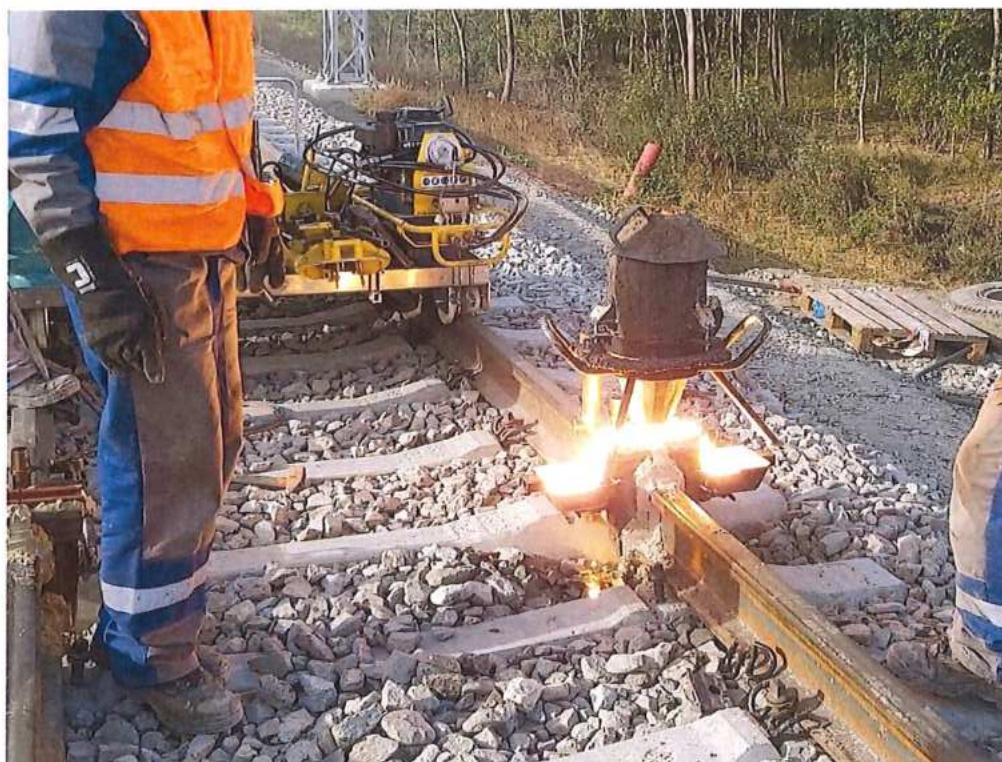
Zváranie koľajníc do bezstykovej koľaje