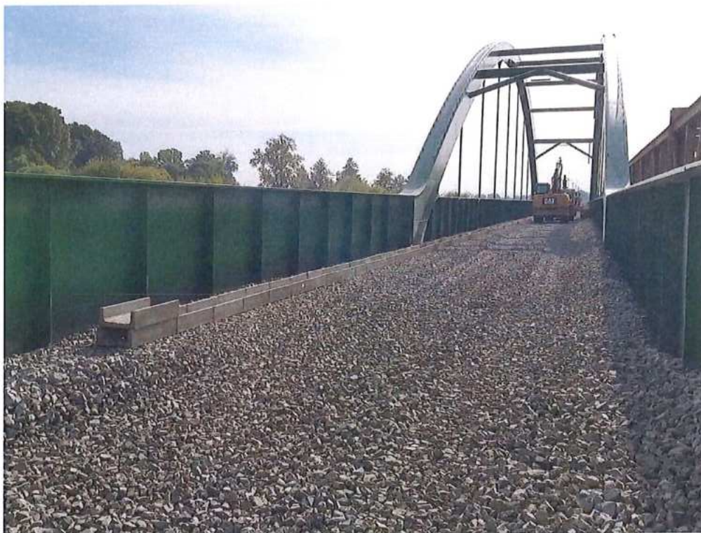
Pokládka kábelových žľabov v km 74,290-74,490