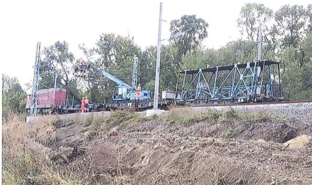
Demontáž trakčného vedenia