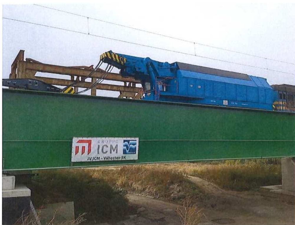
Zaťažovacia skúška mosta SO 12-33-04