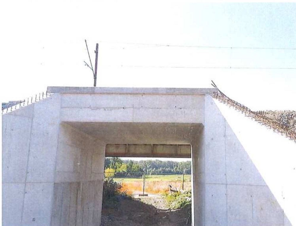
Betónová rímsa - SO 12-33-03