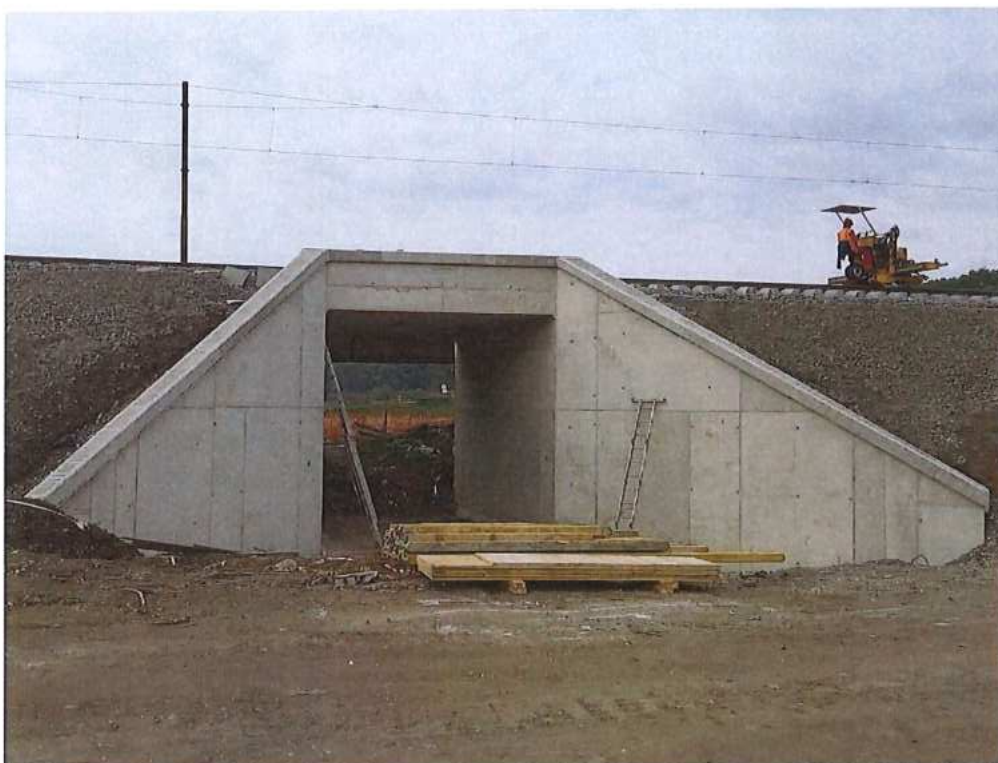
Betónová rímša na krídlach - SO 12-33-03