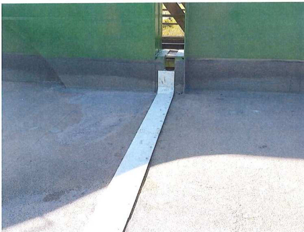
Montáž dilatácie - krycie dosky – SO 12-33-04