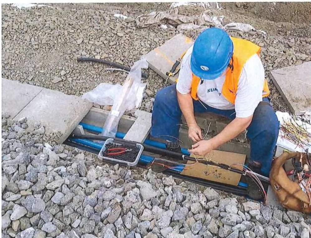
Spojkovanie káblov ZabZar