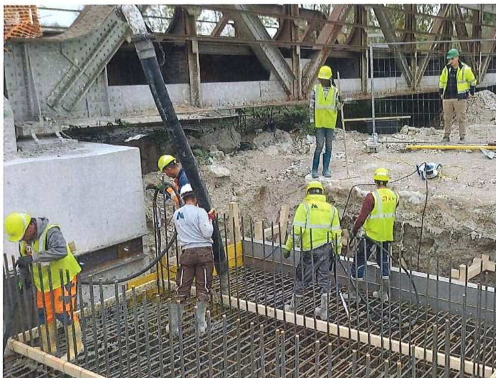
Betonáž základov SO 12-33-01