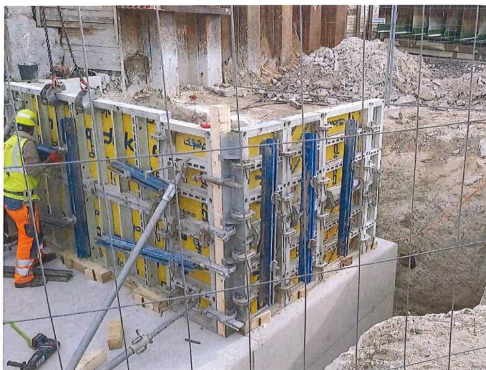
Debnenie opory SO 12-33-01